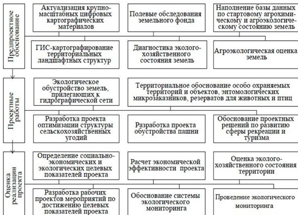
Рис. 2. Схема проведения работ при применении бассейновой концепции в природопользовании

Основой геопланирования на бассейновых принципах является реорганизация структуры угодий [3]. Организация структуры сельскохозяйственных угодий в увязке с рельефом и почвами (адаптивное землеустройство) и формирование экологического каркаса включали следующие этапы: 1) землеустройство пашни на основе бассейновых и позиционно-динамических принципов; 2) проекты лесонасаждений; 3) проекты водоохраных зон; 4) рационализация использования кормовых угодий; 5) проекты рекреационных зон; 6) выявление новых природных резерватов.