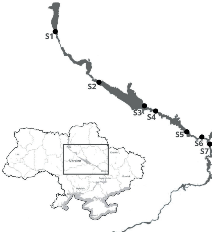
Рис. 1. Територія досліджень поверхневих вод Дніпра зі станціями спостереження якості води в межах питних водозаборів S1-S7

В процесі дослідження були задіяні дані Державного водного агентства, яке проводить моніторинг поверхневих вод відповідно до Порядку здійснення державного моніторингу вод, затвердженого постановою Кабінету Міністрів України від 19.09.2018 № 758. В статті надані результати аналізу даних щомісячних концентрацій сполук азоту (амоній-іонів \text{NH}_4^+ , нітрат-іонів \text{NO}_3^- , нітрит-іонів \text{NO}_2^- ) і фосфору (фосфат-іонів \text{PO}_4^{3-} ) для періоду з січня 2015 року по грудень 2023 року для семи пунктів спостереження, розташованих в межах питних водозаборів басейну Дніпра. Територія досліджень (рис. 1) простягається від міста Вишгород до міста Дніпро та охоплює водозабори Києва в межах міста Вишгород (S1), Черкас (S2), Кременчука (S3), Горішніх Плавнів (S4), Кам'янського (S5) та Дніпра (S6 – вище міста, S7 – нижче міста). Станції спостереження розташовані зверху вниз за течією Дніпра в наступній послідовності: S1 – в межах нижнього б'єфу Київської ГЕС, S2 і S3 в межах верхньої та нижньої частини Кременчуцького водосховища, S4 та S5 в межах верхів'я та нижньої частини Кам'янського водосховища, S6 та S7 в межах Дніпровського водосховища.