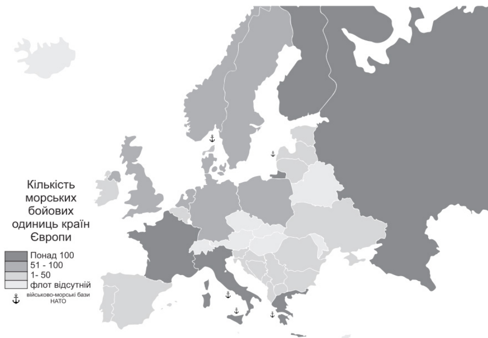
Рис. 2. Розподіл морських бойових одиниць по державам Європи (за [8])

З 44 європейських держав власні військово-морські сили у своєму розпорядженні мають лише 27 країн (рис. 2). Найпотужніший військовий флот сформувався в країнах Північної (Велика Британія, Фінляндія, Данія, Швеція, Норвегія), Південної (Італія, Греція, Іспанія) та Західної (ФРН, Франція) Європи, це, насамперед, пов'язано з історичними особливостями розвитку цих макро-регіонів [4]. Так, ВМС Росії є найчисельнішим серед всіх досліджуваних країн, нараховуючи 148 тис. осіб особового складу та близько 350 бойових кораблів та катерів (1143 «Кречет», 1144 «Орлан», 1164 «Атлант» та ін.); Фінляндія має другі за чисельністю ВМС в Європі, налічуючи 6 тис. осіб особового складу та 270 бойових морських машин («Раума», «Гельсінкі», «Кампела», «Куха» та ін.); військово-морські сили Італії налічують 34 тис. осіб регулярних військово-службовців та 143 бойові кораблі, структурно флот поділяється на 3 ескадри,