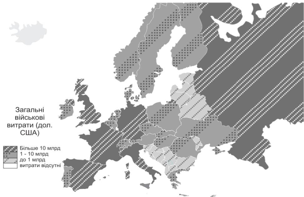
Рис. 1. Загальні військові витрати європейських держав (дол.) [8]

склали 20 % світових військових витрат (рис. 1). Згідно з даними Стокгольмського інституту дослідження проблем миру [6] за 2019 р. вони збільшилися на 2,8 % у порівнянні з 2018 р., але всього на 5,7 % порівняно з 2008 р. З початку 2019 р. військові витрати збільшилися в усіх макрорегіонах Європи. У Центральній і Східній Європі вони збільшилися на 2,4 % та 3,5 % відповідно, тоді як в Західній Європі вони піднялися лише на 2,6 %. У Східній Європі військові витрати за 2019 р. становили 67,7 млрд дол., збільшившись на 78 % у порівнянні з 2009 р. Слід зазначити, що значною мірою це сталося через зростання військових витрат Росії та її військово-політичної агресії. Навпаки, в Центральній Європі військові витрати в період з 2009 по 2019 р. збільшилися на 4,2 %, до 21 млрд дол., у той час, як у Західній Європі витрати за цей період зменшилися на 6,2 % (до 160 млрд дол. у 2019 р.).