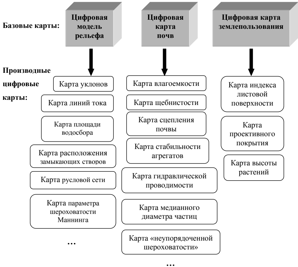
Рис. 2. Структура банка данных пространственного эрозионного моделирования