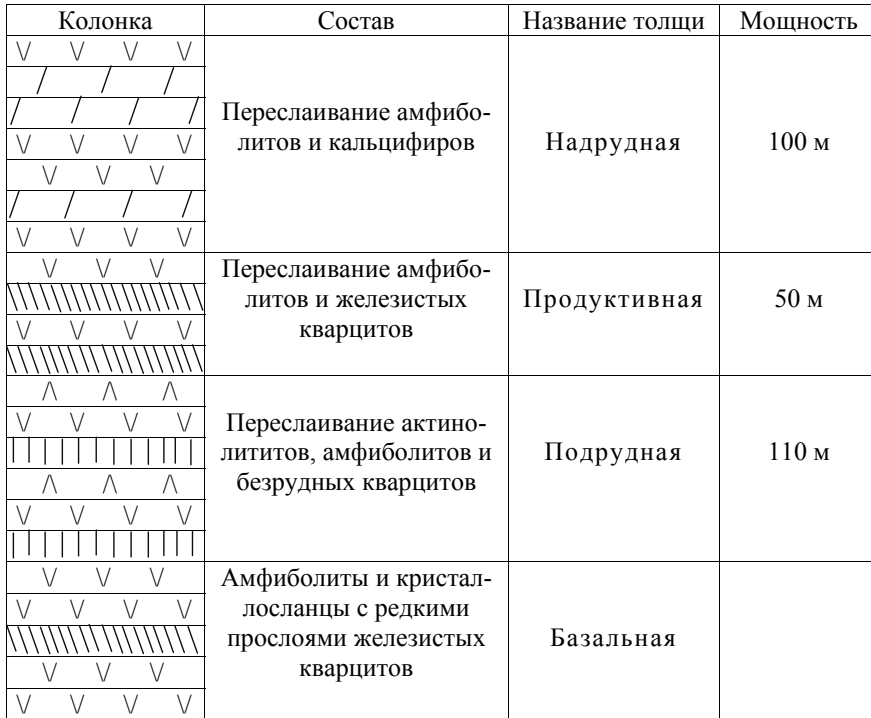
Рис. 1. Схематический разрез Восточно-Капустянского проявления

Анализ литологических колонок пород других разрезов хщевато-завальевской свиты в пределах рассматриваемой области также свидетельствует об их метаксеногенном генезисе. Супракристалльные породы кошаро-александровской свиты и отдельных разрезов нерасчлененной днестровско-бугской серии имеют существенно метатерригенный генезис. На рис. 2 показаны результаты палеореконструкции разреза метаморфических и ультраметаморфических пород по реликтовому циркону на участке Савранского рудопроявления в Побужском районе.