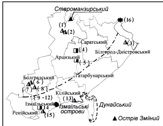
Рис. 1. Об'єкти ПЗФ і їх режим заповідності на території Задністров'я