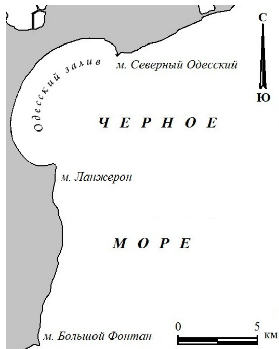
Рис. 1. Схема Одесского побережья между м. Бол. Фонтан и Бол. Аджалыкским лиманом на Черном море в начале XXI века.

Вместе с тем, ряд историков и археологов относят появление Одессы не позже, чем к XIV столетию в виде крупного портового города «Качибей», по всей видимости – украинского. В силу болезненной предвзятости такие авторы во что бы то ни стало хотят, чтобы Одессе было 600 лет [3, 4, 5]. А для этого не брезгают домыслами, догадками, неаккуратным обращением с фактами, тенденциозности, а главное – они не учитывают существенные изменения природных физико-географических условий в течение многих веков. Понятно, что для появления и развития Одессы требовалась достаточно сильная экономическая база: совершенная промышленность, машинное производство, возведение фундаментальных построек и на суше, и на море. Но такие работы были недоступны в XIV веке в условиях причерноморской степи, тем более – «украинцам», а у команов и ногайцев жизненный уклад, традиции и обычаи не способствовали строительству городов, да еще портовых. Построение городов и крепостей в те далекие времена требовало также специальных материалов, длительного времени, – многие десятки лет, как например при постройке Джинестры, Солдайи или Кафы. Судя по апеннинской