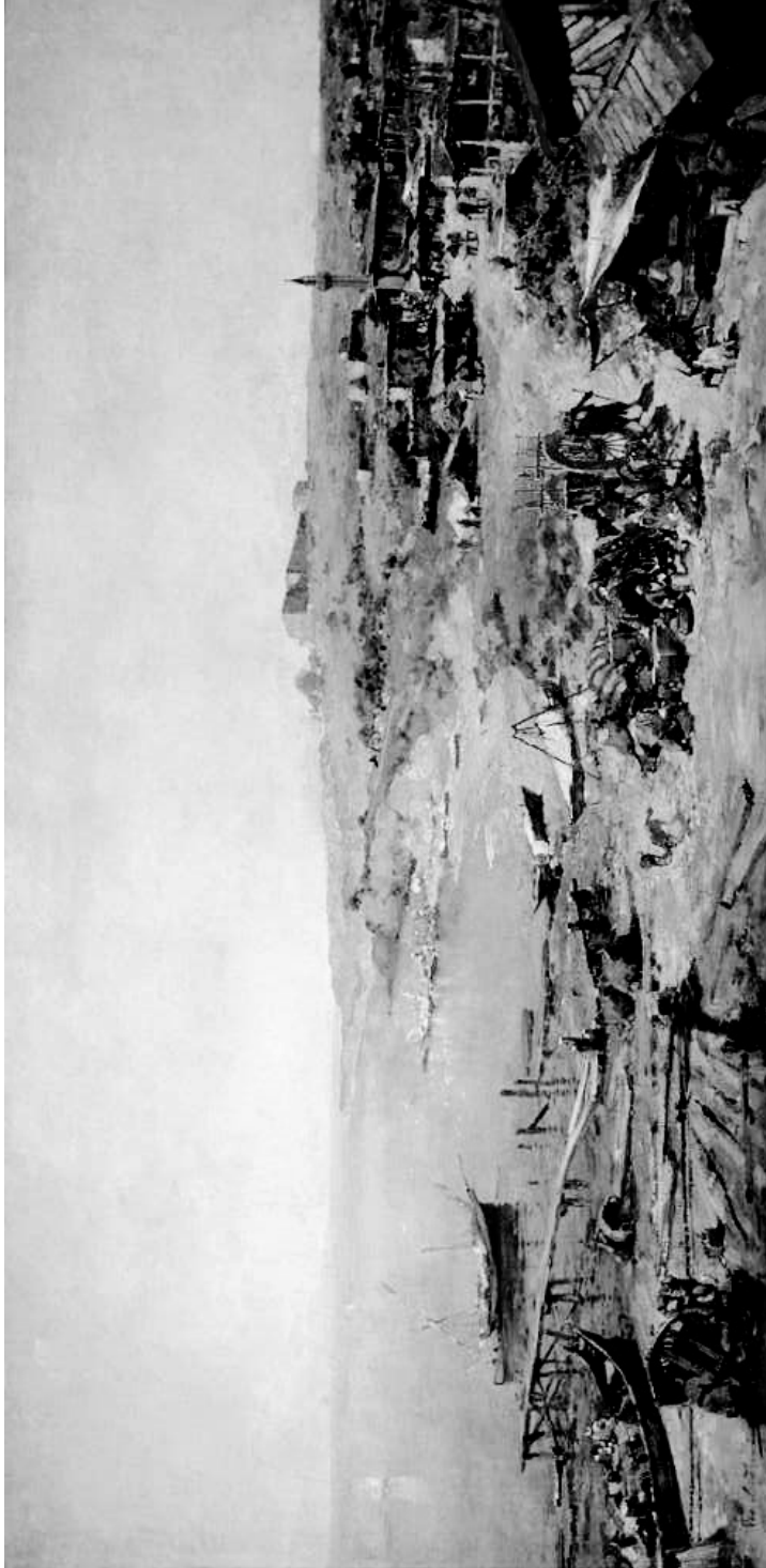
Рис. 2. Натурное изображение древнего турецкого замка (на высоком берегу) и типичного ногойского хутора Хаджибей на месте современной Одессы, предположительно – тогдашнее устье Военной балки. Обращает на себя внимание рыбацкий причал, типичный на Одесском побережье Черного моря.