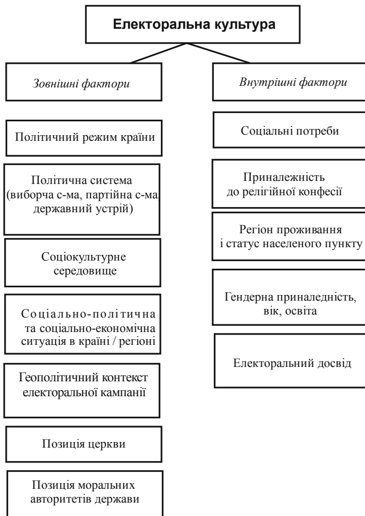
Рис. 1. Фактори, що впливають на електоральну культуру

Результати виборів останнього десятиліття в Україні формують твердження, що сучасна електоральна культура проявляється в двох напрямках: перший пов'язаний з рудиментами радянського періоду, в якому мало проявляються сформовані ідеологічні впливи та існує високий рівень недовіри до політичних інститутів та інституцій; другий напрямок зумовлений медіавпливами та іншими формами сучасної популяризації інформації. Аналіз географії політичної